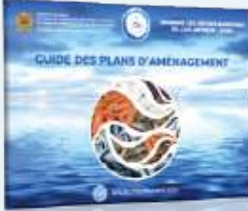
مخطط تهيئة سمك القرش

تتبع وتقييم مخططات التهيئة وإصدار دليل معرفي للمهنيين